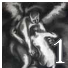
La lutte avec l'ange