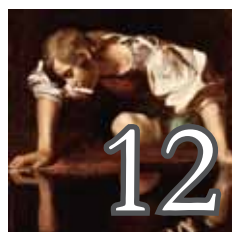
Ressemblance / Ressemblances