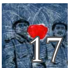
Guerre et paix