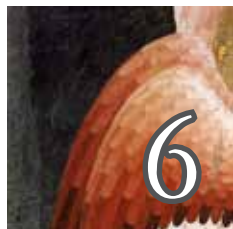
Poésie Existence Spiritualité