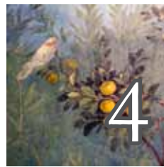
La joie malgré tout, la joie sur le fil du rasoir